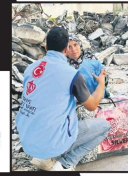
GAZZE'YE 100 TON YARDIM GÖNDERECEK

Ankara Filistin Dayanışma Platformu üyeleri, Filistin Halkıyla Uluslararası Dayanışma Günü' dolayısıyla Ahmet Hamdi Aksoy Caddesi'nde cuma namazı sonrası İsrail'i protesto etti.