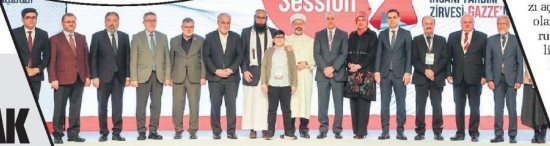
ERDOĞAN'DAN GAZZE İÇİN ULUSLARARASI İNSANI YARDIM ZİRVESİ'NE MESAJ:

göstermesinin sebebi, kanaatinize yalnızca para kazanma hususıyla açıklanamaz. Bu durum, ileride çikabileceği bir sosyal mühendislik projeksiyon sonuçlandır. Çerek yazılı ve görsel medyada, genelde sosyal medya mecralarında artan şikâretçi yayıncıların asla masum olmadığını inanıyoruz. Bölgeniz yangını yeri iken, iç cepimizde gedik açmayı hedefleyen her türlü girişimi milli güvenlik açısından değerlendirilmekteyiz.