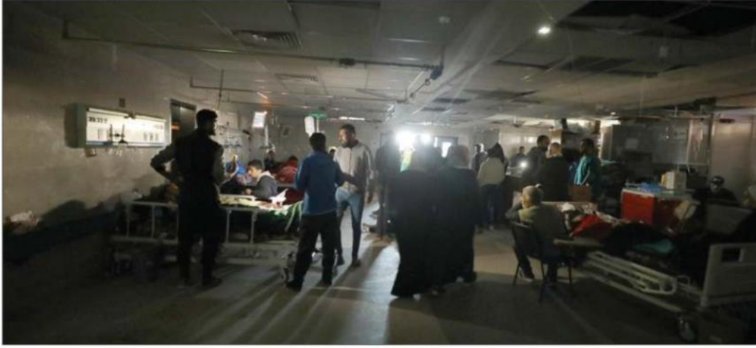
İsrail'in sağlık sistemini hedef alarak Gazze'de yaşamı yok etmeyi amaçladığını ifade eden Filistinli doktorlar, bölgede cerrahi hizmet verebilen tek bir hastanenin kaldığını ve bu hastanede 150 yaralının bulunduğunu dile getirdiler.