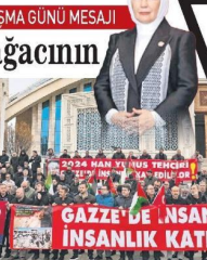
GAZZE'DE İNSANLAR İNSANLIK KATLEDİLİ

yer alıyor. Zirvede, "Gazze'nin İnsani Krizi ve Geleceğe Bakış", "İnsani Yardım Müdahaleleri ve Acil Çözümler", "Gazze İçin İyileşme ve Sürdürülebilir Stratejiler" ve "Blokajı Sonlandırmak İçin Yenilikçi Stratejiler" konu başlıkları masaya yatırılacak. Katılımcılara Türkiye, Avrupa ve İngilizce olmak üzere üç dilde hizmet verecek zirve bugün sona erecek.