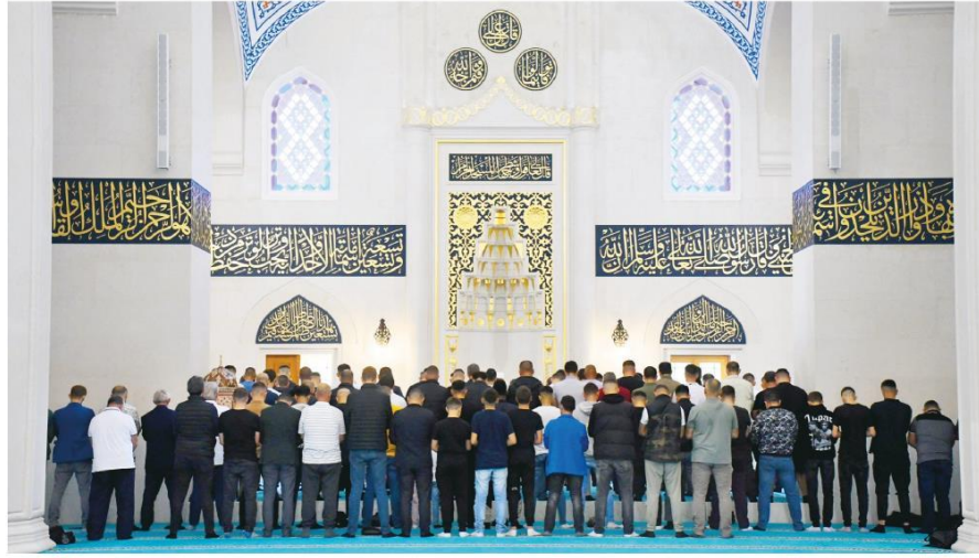
● Açılışı 10 Ekim'de gerçekleştirilen ve Balkanlar'ın en büyük camisi konumundaki Tiran Namazgah Camisi , Diyanet İşleri Başkanlığı ve Türkiye Diyanet Vakfı'nın (TDV) desteğiyle inşa edildi. Caminin içi ve dışında 10 bin kişi aynı anda namaz kılabilir.