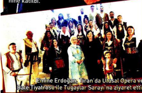
Emine Erdoğan, Tiran'da Ulusal Opera ve Bale Tiyatrosu'na Tugaylar Sarayı'na ziyaret etti.

Arnavutluk Başbakanı Rama ile ortak basın toplantısında konuşan Başkan Erdoğan, Tiran'dan dünyayı uyardı: Netanyahu hükümeti küresel düzeni tehdit eder hale geldi