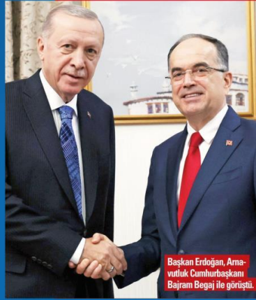
Başkan Erdoğan, Arnavutluk Cumhurbaşkanı Bajram Begaj ile görüşti.

Netanyahu hükümetinin, bölgesel kapsamının ötesinde artık küresel düzeni tehdit eder hale gelen saldırı-ganlıkları hakkındaki görüşlerini de paylaştığımız belirten Erdoğan, "Gazze'de bir yıldır devam eden soykırım tüm insanlığın ortak utançtır. Bu nedenle acilen kalıcı ateşkesin sağlanması, insani yardımların ulaştırılması ve İsrail üzerinde gerekli baskının oluşturulması için uluslararası toplum olarak elimizden gelen gayreti göstermemiz gerekiyor. Bu konuda Arnavutluk'un da üzerine düşeni yerine getireceğine samimiyle inanıyorum" ifadelerini kullandı.