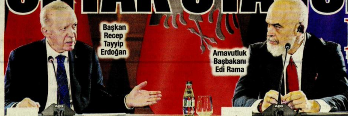
Başkan Recep Tayyip Erdoğan