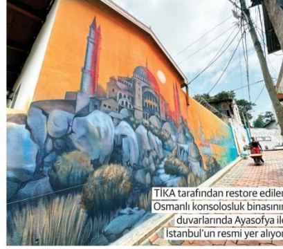
TIKA tarafından restore edilen Osmanlı konsolosluk binasının duvarlarında Ayasofya ile İstanbul'un resmi yer alıyor.