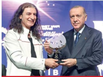
Cumhurbaşkanı Erdoğan, Yurt İçi Vefa Ödülüne layık görülen, sanatçı Murat Kekilli'ye plakettini verdi.

"İsrail'in soykırım suçu işlediğine dair elimizdeki tüm belgeleri muhataplarımıza iletiyoruz" diyen Cumhurbaşkanı, "Davaya biz de müdahil olmayı kararlaştırdık. Norveç, İrlanda ve İspanya'nın, Filistin devletini tanıyacıklarını açıklamalarından büyük bir memnuniyet duyuyorum" şeklinde konuştu