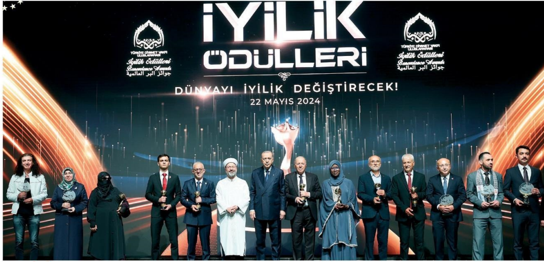
İYİLİK ÖDÜLLENDİRİLDİ Türkiye Diyanet Vakfı (TDV) Uluslararası İyilik Ödülleri, Cumhurbaşkanı Recep Tayyip Erdoğan'ın katıldığı törenle sahiplerini buldu. Türkiye ve dünya genelindeki iyilik öncülerine ödül takdim etmek üzere Beştepe Millet Kongre ve Kültür Merkezi'nde düzenlenen törende, ödüller Cumhurbaşkanı Erdoğan tarafından verildi. Takdim töreninde Diyanet İşleri Başkanı Ali Erbaş da yer aldı.