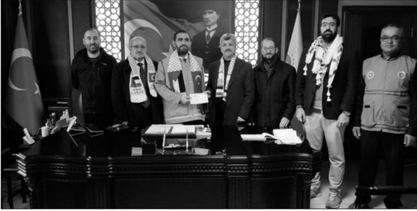
Isparta meydanında bir süre önce kurulan Gazze