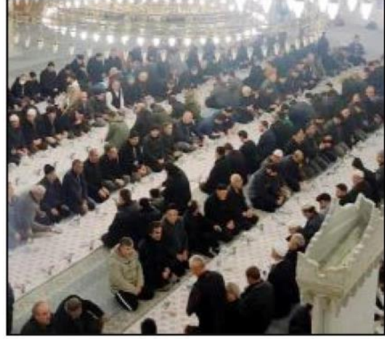
Akşemseddin Camii'ndeki etkinlikte vatandaşlara hurma, simit ve meyve suyu ikram edildi.