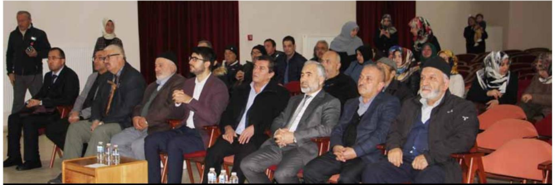
3 Aralık Dünya Engelliler Günü nedeniyle Türk Diyanet Vakfı Çankırı Şubesi Kadın Kolları tarafından bir program gerçekleştirildi. Programda dikkat çeken önemli bir nokta ise programın sonuna kadar bir eğitmenin işaret dili ile konuşmaları konuklara aktarması oldu.