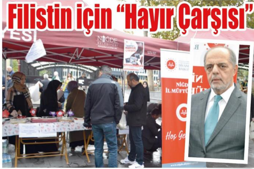
Niğde İl Müftülüğü İsrail'in saldırılarından zarar gören Filistinlilere destek olmak amacıyla 'Filistin için Hayır Çarşısı' kermesi düzenledi. 2'DE