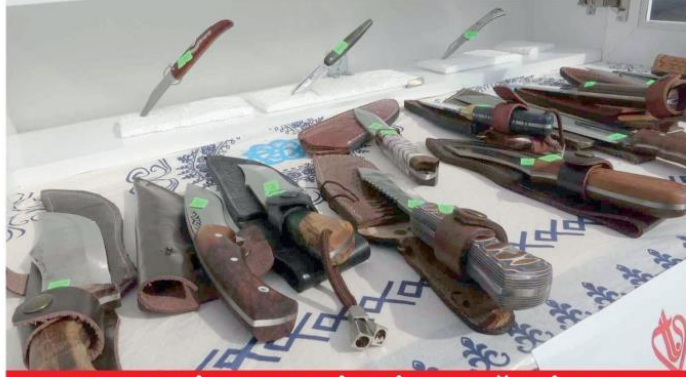
KOLEKSİYON 50 BİN LİRA DEĞERİNDE

T OKAT'TA Sadullah Sezer isimli vatandaş 5 yıldır özenle oluşturduğu bıçak koleksiyonunu Diyane Vakfı tarafından düzenlenen panayırda satışa çıkardı. Yaklaşık 50 bin lira değerinde olan koleksiyonunu satışa çıkaran Sezer, elde edeceği tüm geliri Filistin'e bağışlayacağını açıkladı. Şu ana kadar 17 bin lirahik satış yapan Sezer, bütün koleksiyonunu satmayı hedefliyor. Koleksiyonun da yöresel birçok bıçak bulunan Sezer, Filistin'e destek olmak için 5 yıldır özenle topladığı bıçaklarını kurduğu küçük tezgahında sergileyip satıyor.