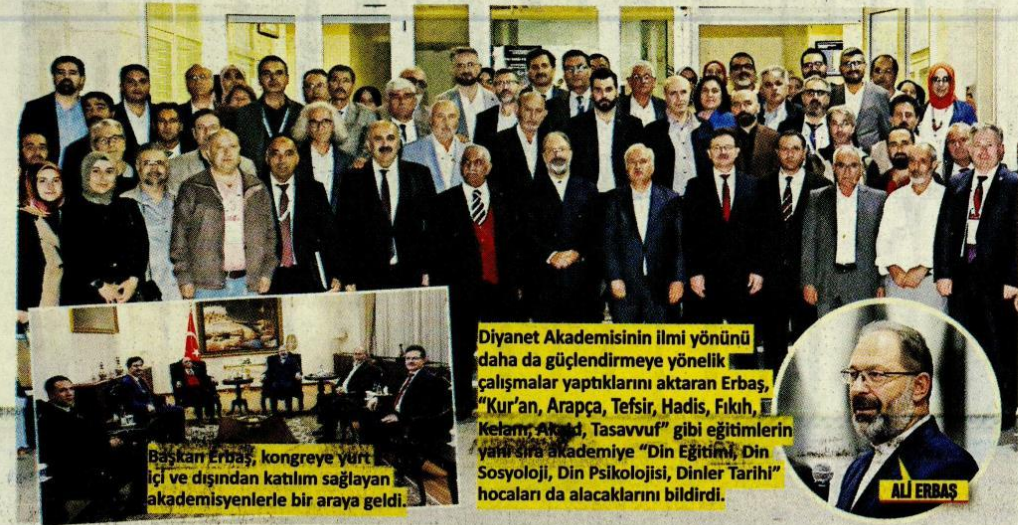
Başkan Erbaş, kongreye yurt içi ve dışından katılmaya gelen akademisyenlerle bir araya geldi.

1. Türkiye Dinler Tarihi Kongresi"nde konuşan Diyabet İşleri Başkanı Ali Erbaş , "Doğru dini bilgiyi en güzel şekilde veren ülke, bizim ülkemizdir. Aşırılıklardan, hurafelerden uzak, Kur'an ve sünnet çizgisinde bir eğitimi her zaman önceliyoruz" dedi.