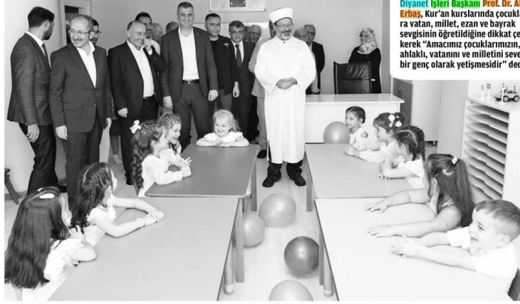
Diyanet İşleri Başkanı Prof. Dr. Ali Erbas , Kur'an kurslarında çocuklara vatan, millet, ezan ve bayrak sevgisinin öğretilmesine dikkat çekerek "Amacımız çocuklarımızın, ahlaklı, vatani ve milletini seven bir genç olarak yetişmesidir" dedi.