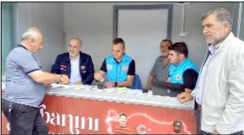
Biçer tüm hayırseverleri Saat Kulesi yanındaki standı davet etti.