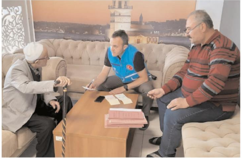
Türkiye Diyanet Vakfı yetkilileri huzur evine giderek vekaleten kurban bağıışı işlemlerini yaptılar.