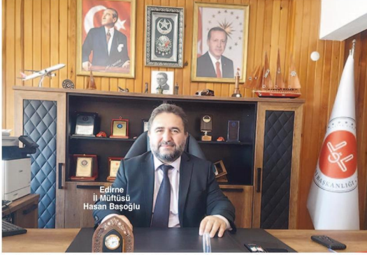
Edirne İl Müftüsü Hasan Başoğlu

K urban bağışında geçen yıl olan 550 bin kurban hissesinin bu yıl 700 bine çıkarmak istediklerini kaydeden Başoğlu, imkan sahipleri ile ihtiyaç sahiplerini buluşturmayı he-