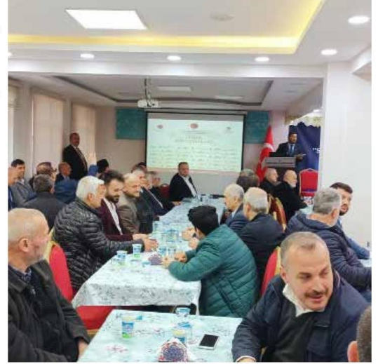
"Kardeşliğimiz Zekâtla Bereketlensin" projesi başlatılmıştır" dedi

Bu sebeple Diyanet İşleri Başkanlığı ve Vakfımız işbirliği ile infak duygusu yüksek hayırsever halkımızın Zekâtlarını yurt içinde ve yurt dışında olabildiğince geniş kitlelere ulaştırmak, Zekât'ın sadece Ramazan döneminde toplanmayıp yıl boyunca etkin bir şekilde toplanmasını sağlamak, halkımızda ve İslam Dünyasında Zekât farkındalığının ve kültürünün yaygınlaştırılmasına katkıda bulunmak, Müslüman kardeşlerimizle yardımlaşma, dayanışma konusundaki çabaları desteklemek amacıyla