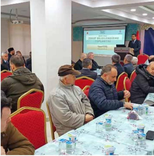
Kırklareli Müftülüğü ve Türkiye Diyanet Vakfı Kırklareli Şubesi