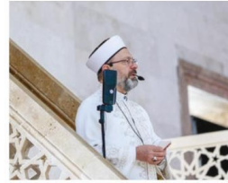
Diyanet İşleri Başkanı Ali Erbaş, Ahmet Hamdi Akseki Camisi'nde hutbe irat etti.

Ramazanın rahmet ve bereket ikliminden istifade edilmesini tavsiyesinde bulunan Erbaş, "Rabb'imizin lütfettiği nimetleri bizler de ihtiyaç sahibi kardeşlerimizle paylaşmaya devam edelim. Rabb'imizin mağfiretine mazhar olmak için af yolunu tutalım. Kulluğun zirvesi olan ihسان bilinciyle dünyamızı güzelleş-