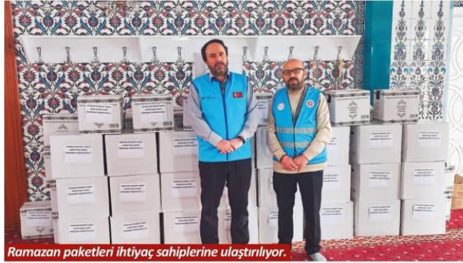
Ramazan paketleri ihtiyaç sahiplerine ulaştırılıyor.