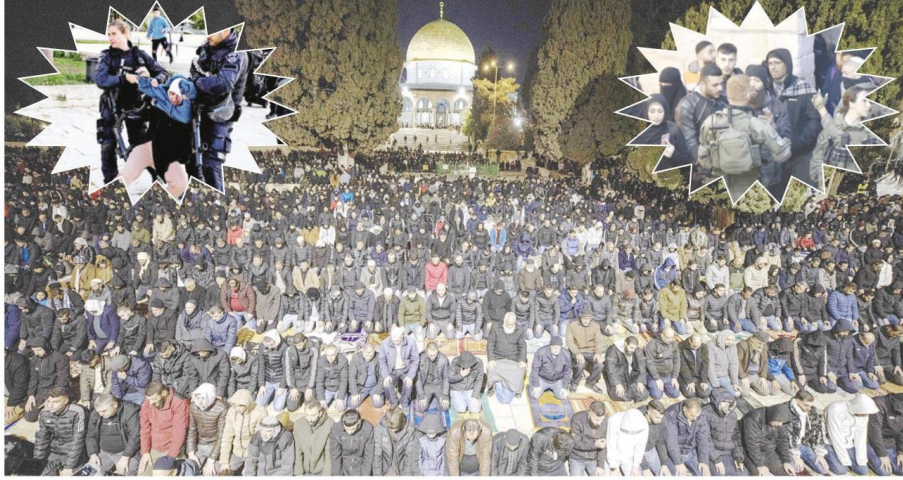
İsraîl polisi, Mescid-i Akşa'ya baskın düzenleyerek itikaf eden bazı Filistinlileri Silsile Kapısı'ndan dışarı çıkarmaya zorladı.