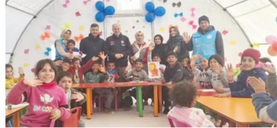
Diyanet İşleri Başkanlığı tarafından deprem bölgesinden farklı illere giden 390 bin 661 afetzede de manevi destek hizmeti veriliyor.

Din Hizmetleri Genel Müdürü Kondi, "Kur'an-ı Kerim Ziyafeti" programına katılmak üzere geldiği Malatya'da, depremin olduğu ilk günden itibaren Diyanet İşleri Başkanlığı ile tüm kamu kurum ve kuruluşlarının afetten etkilenen böl-