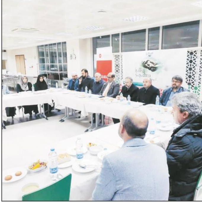
Karaman İl Müftülüğü ve Türkiye Diyanet Vakfı

Karaman Şubesi ev sahipliğinde hayırseverlere yönelik Zekat Bilgilendirme Toplantısı gerçekleştirildi.