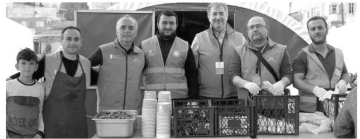
DİTİB'in gönüllüleri, Türkiye Diyanet Vakfı (TDV) koordinasyonunda 16 farklı noktada kurulan iftar ve sahur sofralarında hizmet etmenin sevincini yaşıyor.