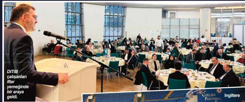
DİTİB çalışanları iftar yemeğinde bir araya geldi.

"Ramazan-ı Şerif Ayı Dayanışma Ayıdır" diyen DİTİB Genel Başkanı Dr. Muharrem Kuzey, "Ramazan-ı Şerif ayına giriyoruz derken yüreklerimizi dağıyan bir hadiseyle karşı karşıyayız. Deprem in ardından yaralıları sarmak için teşkilat olarak Almanya genelinde nakdi yardım kampanyası başlattık. Diyaret Vakfı mızın koordinatörlüğünde yaklaşık bin konteyner konutumuz şu anda yerleştirildi. Ramazan ayı bitinceye kadar en azından 2 bin 500 konteynerimizi daha bölgeye yerleştirmeyi hedefliyoruz. "İfta- rım ve Sahurum Kardeşimle Paylaşıyorum" temasıyla bölgedeki depremde kardeşlerimize iftar ve sahurluklar hazırlamaya gayret gösterdik. Bunun çabası içerisindeyiz. Bölgeye giden gönüllü ekibimiz oradaki organizasyonları tamamladılar. Günlük 15 noktada yaklaşık 15 bin kardeşimiz ile iftar sofrasında lok-