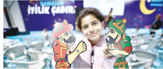
Antakya'daki "İyilik Çadırı"nda, görevliler ile gönüllüler depremdede çocuklara iftar öncesinde oyunlar oynadı, yarışmalar düzenlendi.