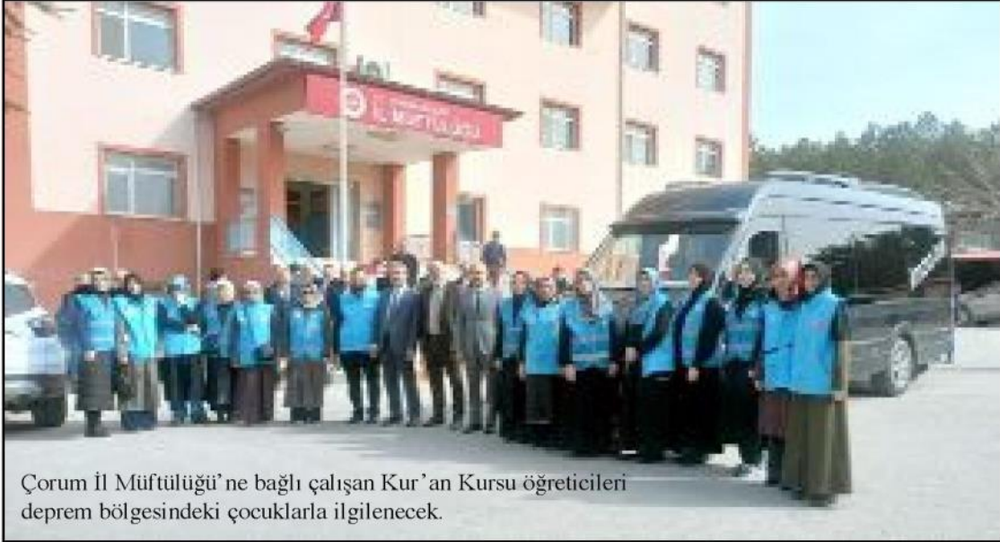
Çorum İl Müftülüğü'ne bağlı çalışan Kur'an Kursu öğreticileri deprem bölgesindeki çocuklarla ilgilenecek.