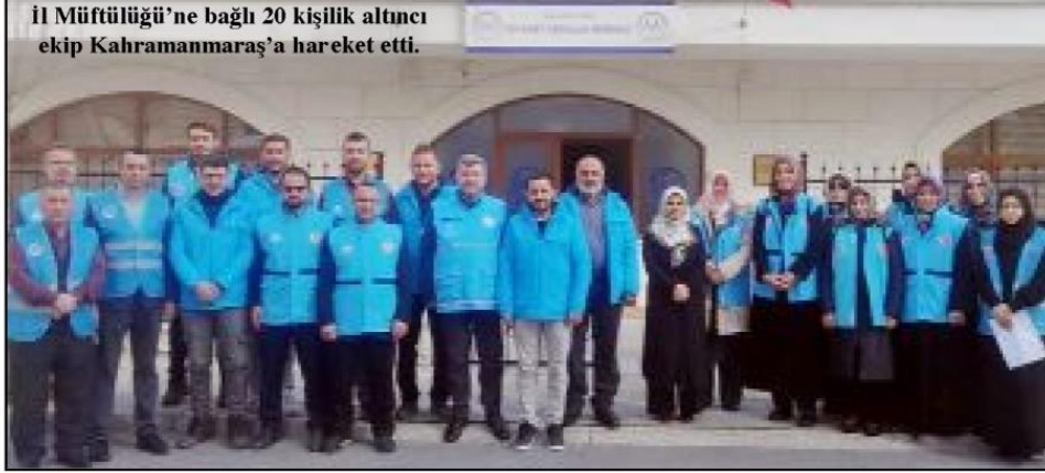
İl Müftülüğü'ne bağlı 20 kişilik altıncı ekip Kahramanmaraş'a hareket etti.