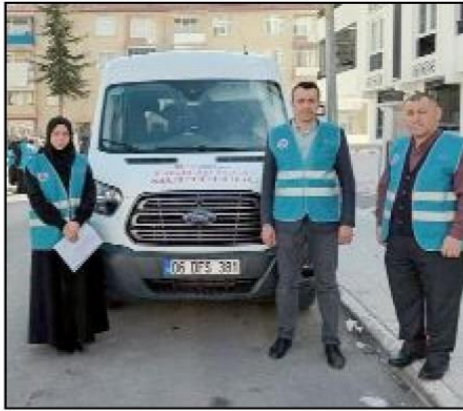
Din görevlileri deprezdelere manevi destek hizmeti sunarken, yardım yüklü 2 minibus ile bölgeye hareket etti.