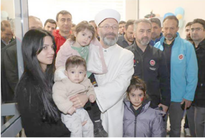
Diyanet İşleri Başkanı Prof. Dr. Ali Erbaş,