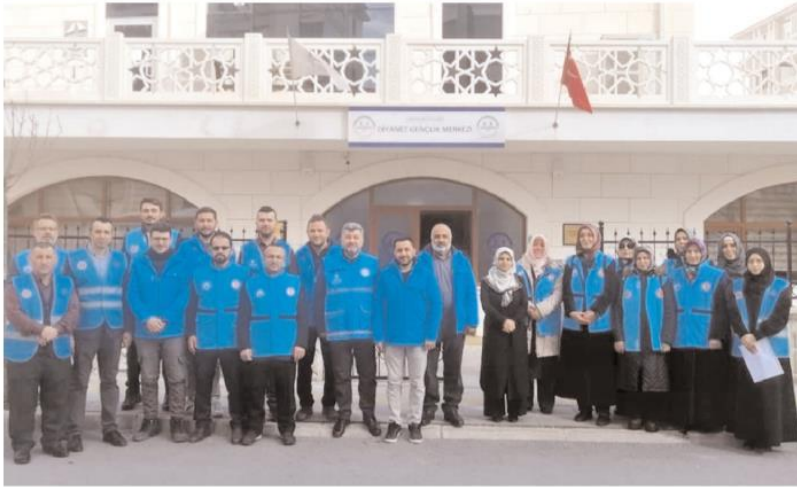
Ekte 20 din gönüllüsü bulunuyor.