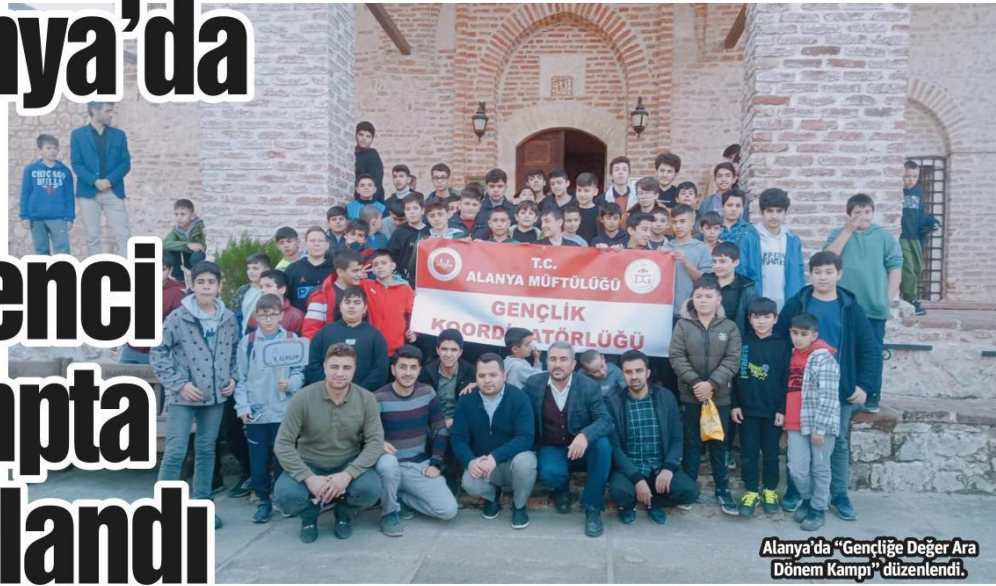
Alanya'da "Gençliğe Değer Ara Dönem Kampı" düzenlendi.

■ ALANYA Müftülüğü Gençlik Koordinatörlüğü tarafından öğrencilerin tatil dönemlerini değerlendirmek, bilgi, ahlak ve merhamet duygularıyla yetişmelerine katkı sunmak amacıyla lise ve ortaokul öğrencilerine yönelik "Gençliğe Değer Ara Dönem Kampı" düzenlendi.