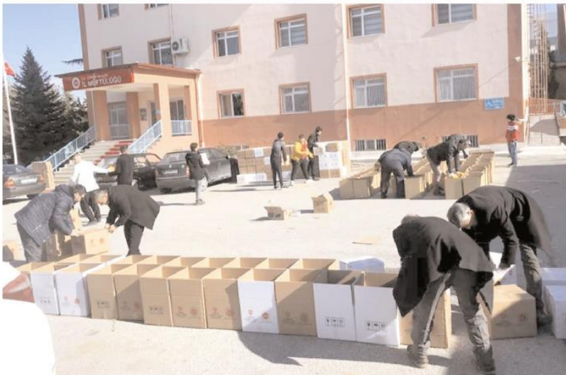
TDV Çorum Şubesi depremin yaşandığı ilk günden bu yana 6 tır dolusu insani yardım malzemesi gönderdi.

Diyanet İşleri Başkanlığı ve Türkiye Diyanet Vakfı koordinesinde deprem bölgesinde yardım faaliyetlerine devam eden din görevlileri, oluşturulan çadır kentlerde depremden etkilenen ailelerin acısını paylaşıyor.