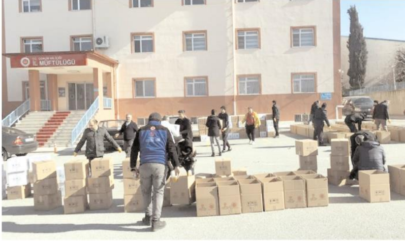
Yardımlar İl Müftülüğü bahçesinde tasnif edildi.