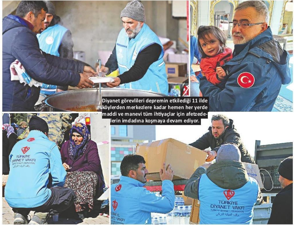
Diyanet görevlileri depremin etkilediği 11 ilde köylerden merkezlere kadar hemen her yerde maddi ve manevi tüm ihtiyaçlar için afetzedelerin imdadına koşmaya devam ediyor.