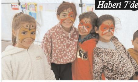
Depremden Etkilenen Çocuklar Diyanet Çocuk Etkinlik Alanında Eğleniyor