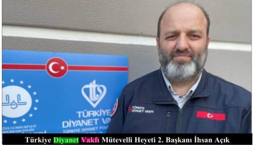
Türkiye Diyanet Vakfı Mütevelli Heyeti 2. Başkanı İhsan Açıık

Bölgede çok yönlü yardım hizmeti yaptıklarını belirten Açıık, "Deprem bölgesinden çok sayıda Kur'an-ı Kerim talebi oldu. 'Mezarlıkta çadırda ölmüşlerime Kur'an-ı Kerim okumak istiyorum' şeklinde. Acilen bölgeye 15 bin Kur'an-ı Kerim gönderdik. Halen de şu anda yeni basımlar yapılıyor. Bölgeye daha çok Kur'an-ı Kerim ve özellikle dini içerikli çocuk kitapları gönderece-