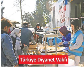
Türkiye Diyanet Vakfı