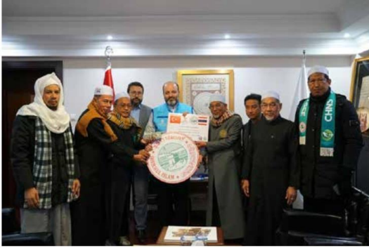
HABER: UĞUR HALEP

Türkiye'ye yaklaşık 7 bin 500 km uzaklıkta