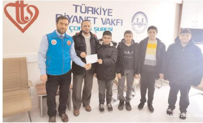
Hafızlık öğrencileri, kumbaralarında biriktirdikleri harçlıklarını ve çevrelerinden topladıkları yardımları depremzedelere gönderdiler.

Müftü Biçer de hafız öğrencilere duyarlı davranışlarından ötürü teşekkür etti. (Haber Merkezi)