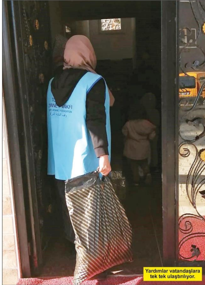
Yardımlar vatandaşlara tek tek ulaştırılıyor.