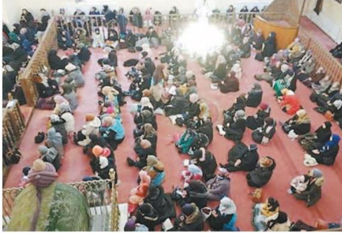
Kadın vaizler tarafından okunan Kur'an-ı Kerim tilavetiyle başlayan program salavat-ı şerife ve tekbirlerle devam etti