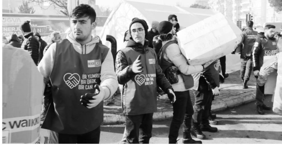
: Kahramanmaraş merkezli depremlerden etkilenen 10 ilde vakıf ve derneklerin de aralarında bulunduğu çok sayıda kuruluş, sahada yardım faaliyetleri yürütüyor.