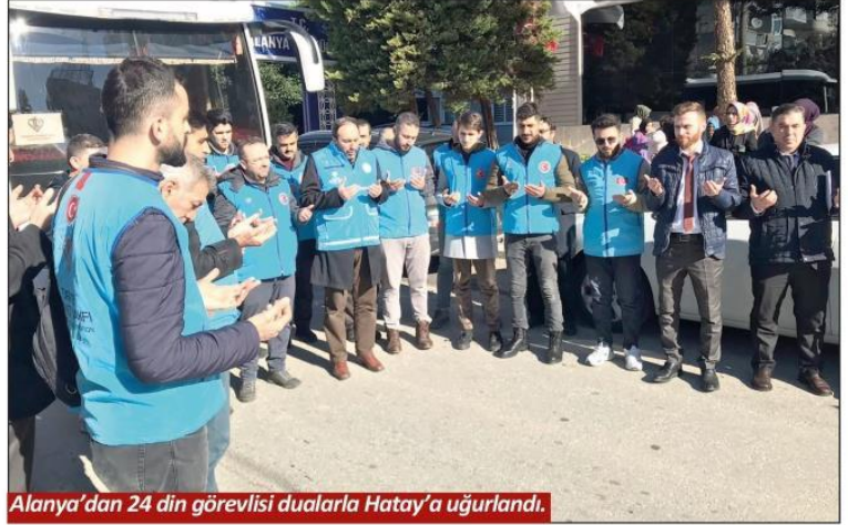
Alanya'dan 24 din görevlisi dualarla Hatay'a uğurlandı.