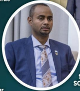
Yeni fırsatlar sunuyor.

SOMALİ'NİN yeni cumhurbaşkanı Hasan Şeyh Mahmud'un hedeflerini ve ülkedeki yeni dönemi Somali Savunma Bakanı Abdulkadir Muhammed Nur, siz kıymetli okuyucularımız için kaleme aldı. 1960'larda Afrika'da demokrasi rasisinin beşiği addedilen Somali, 15 Mayıs 2022'deki seçimlerde bölgede benzeri görülmemiş şekilde barışçıl yollarla gerçekleşen güç transferine şahitlik etti. Seçim sürecinde yaşanan olumsuzluklar uluslararası toplumu Somalî'de işlerin daha kötüye gideceği yönünde bir beklentiye itmişti. Fakat seçim sonuçları Somalililerin artık çatışma değil, huzur istediklerini tüm dünyaya gösterdi. Bunun en önemli göstergesi ise "Hem İçeride hem dışarıda barış" sloganını kullanan Hasan Şeyh Mahmud'un yüzde 66,05 ile tekrar cumhurbaşkanı seçilmesi oldu. Mahmud'un cumhurbaşkanı seçilmesi, hem Somalî'de hem de Doğu Afrika'da barış, güvenlik ve ekonomik kalkınmanın sağlanması için