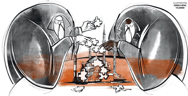
ILLUSTRASYON: CEMİLE AĞAC YILDIRIM

T ürkiye ile Etiyopya (eski adıyla Habeşistan) arasındaki münasebetler 16. yüzyılın ikinci yarısında başladığından beri bir dargın bir barışık uzatmalı sevgili ilişkisi gibi sürmüştü. Osmanlı döneminde Habeşistan'la kimi zaman oldukça sert kimi zaman da oldukça dostane ilişkiler yaşanmış, günümüzde Eritre'den bugünkü Kenya sınırına kadar olan bölge o yıllarda Habeş eyaleti olarak uzun bir süre Osmanlı Devleti'nin hakimiyetinde kalmıştı. Sultan II. Abdülhamit ve Habeşistan kralı II. Menelik dönemi ise iki ülke tarihi açısından yeni bir dönemin başlangıcıdır. Harar eyaletinin Müslümanların elinden düşmesi iki devlet arasında gerginliğe yol açsa da, bir süre sonra karşılıklı heyetlerin gönderilmesi ile dostane ilişkiler tekrar kurulmuştur. Hilal-i Ahmer Cemiyeti'nin Harar'da açılması bunun yanı sıra Osmanlı Devleti'nin Harar eyaletine konsolosluk kurması ve burada görev yapan konsoloslar içinde de Mazhar Bey'in Etiyopya tarihinde oynadığı rol son derece kritik ve etkileycidir.