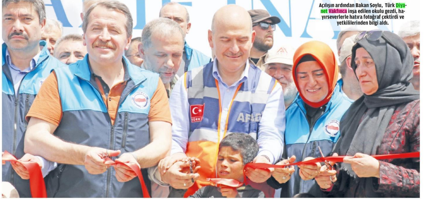
Açılışın ardından Bakan Soylu, Türk Diyanet Vakfınca inşa edilen okulu gezdi, hayırseverlerle hatıra fotoğrafı çekirtti ve yetkililerinden bilgi aldı.

İçişleri Bakanı Süleyman Soylu, Suriye'nin İdlib bölgesinde Türk sivil toplum kuruluşları tarafından yaptırılan yetim köyü ile cami ve çocuk oyun alanlarının açılışını gerçekleştirdi.