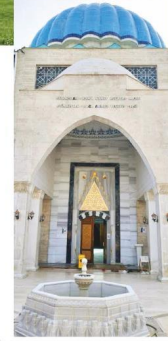
üzerinde öğrencimiz var.

Ahmet Yesevi Üniversitesi, dünyada hükümetler arası kurulan ilk üniversite aynı zamanda. İki parlamentonun onayıyla kurulan özel bir üniversiteyiz, dünyada bugün 15'e yakın böyle okul varken, dünyada kurulan ilk uluslararası üniversiteyi kuran da Kazaklar'la ortak olarak kuran biziz. 4 dil bilen bir çok mezunumuzun olması çok kıymetli. Tıp Fakültesi, Diş Hekimliği gibi fakültelerimizde alanında uzman her ay 4 profesörümüzü burada misafir ediyoruz, Kazakistan'da yapılmayan ameliyatları ücretsiz olarak biz yapıyoruz. Aslında biz burada sadece eğitim