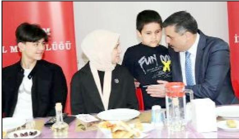
Daire müdürlerinin de hazır bulunduğu programa 58 öğrenci ile aileleri iştirak etti.