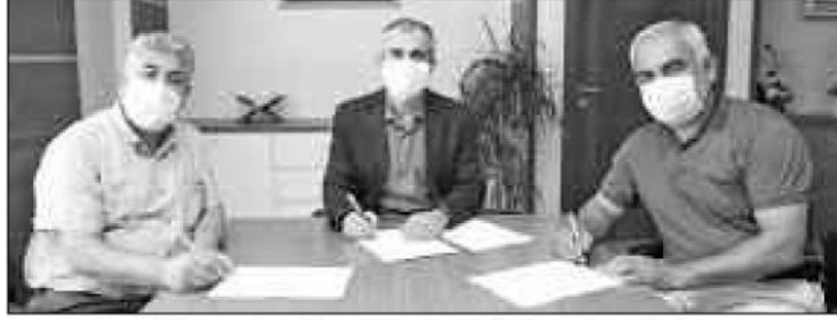
Kümeevler Camii Projesi için imzalar atıldı.

kezi, Kuran kursları, eğitim salonları, çok amaçlı kültür salonu ve 3 bin kişilik caminin yer alacağı proje 6 bin metrekare alan üzerine inşa edilecek. Çayırova Mahallesi 5206 sokak üzerinde başlayan inşaat çalışmalarının daha hızlı ve sistemli bir şekilde yürütülmesi adına gerçekleştirilen protokol ile caminin tam donanımlı bir şekilde tamamlanması ve ibadete açılması planlanıyor.