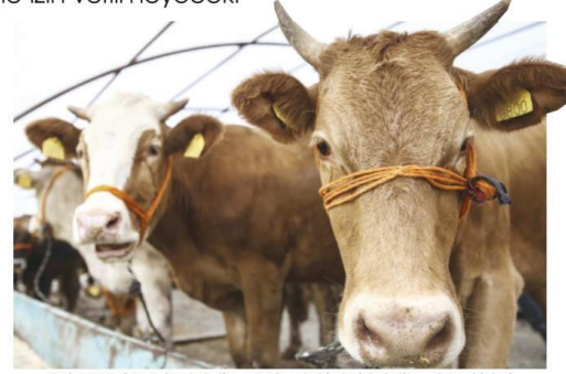
Kesim yerleri, resmi ve belediye veteriner hekimleri, belediye zabıta ekipleri ile din görevlileri iş birliğinde etkin olarak denetlenip kontrol edilecek.

PARK , bahçe, cadde, sokak, bina önleri, meydan gibi umuma açık ve kurban satış ile kesimine uygun olmayan yerlerde bu tür faaliyetlerde bulunanlar ile kesime uygun alanlarda gerekli önlemleri almayanlara Çevre Kanunu'nun 20'nci maddesi gereğince 351 TL idari para cezası uygulanacak. Kurban kesim yerlerinde gerekli yasaklara uymayan ve önlem almadan kurban atıklarını toprağa veren tesislere, toplu kesimler için 88 bin 499 TL, bu fiilin konutlarda işlenmesi halinde 2 bin 199 TL idari para cezası verilecek.