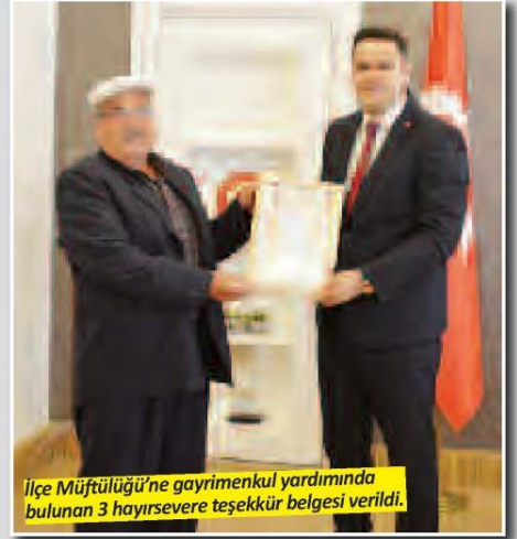
İlçe Müftülüğü'ne gayrimenkul yardımında bulunan 3 hayırsevere teşekkür belgesi verildi.