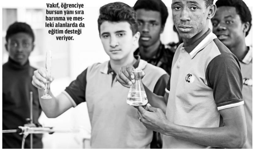
Vakıf, öğrenciye bursun yanı sıra barınma ve mesleki alanlarda da eğitim desteği veriyor.

yıl bin 38 yeni öğrencinin kaydı yapıldı. Ayrıca yüksek lisans ve doktora programında mülakat aşamasında bin 38 öğrenci bulunuyor." ifadelerini kullandı.