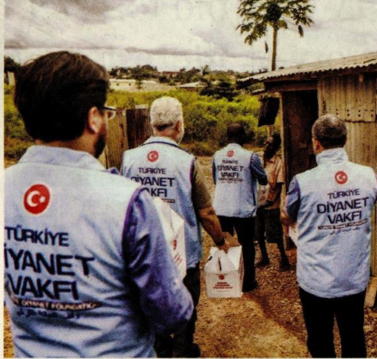
The TDV staff are seen distributing sacrificial meat during the Eid al-Adha.

ity organizations sent 70,000 rations of meat to poor families in Niger during the Eid al-Adha.