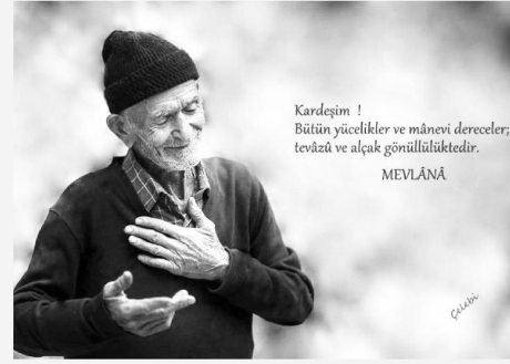
Kardeşim ! Bütün yücelikler ve mânevi dereceler; tevazü ve içliak gönüllülüktedir. MEVLÂNÂ

sizlere bırakmak isterim vaktiniz müsait olursa kendiniz için. Hepimiz için, bütün insanlık için kitaba açıyoruz gönüllü mü ve kalplerinize emanet ediyoruz yüce hitab: "Yeryüzünde hakıze yere böbürleneni, iyelerimden uzaklaştıracağım (onlar anlamayacaklar). Onlar, bütün mucizeleri görseler yine de iman etmezler. Doğru yolu görseler, onu yol edinmezler. Fakat ağırlık yoluna görürse, hemen onu yol edinirler. Bu durum, onların iyelerimden uzaklaştırılacağından ve onlardan gafil olmalarından ileri gelmektedir" (A'raf, 146).