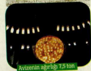
Avizelerin ağırlığı 7,5 ton.