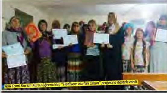
Yeni Cami Kur'an Kursu öğrencileri, "Hediyem Kur'an Olsun" projesine destek verdi.

STK'lar ve dini idarelerden gelen talep üzerine bu coğrafyalara ulaştırılmaktadır. Yurt içinde ise imam hatip liseleri, ilahiyat fakülteleri, yükseköğrenim öğrenci yurtları, hastaneler, ceza evleri, il ve ilçe kütüphanelerinin talepleri, müracaat önceliğine göre değerlendirilerek proje imkânları çerçevesinde talepler karşılanmaya ve mealli Kur'an-ı Kerim'ler kendilerine ulaştırılmaya çalışılmaktadır."