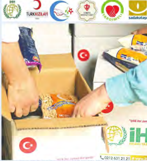
Türk hayırseverler her Ramazanda olduğu gibi bu Ramazan ayında da mazlum coğrafyalardaki Müslümanlara yardım ellerini uzatacak. Türk Kızılayı, İHH, TDV, Deniz Feneri Derneği, Cansuyu, Beşir Derneği, Hüdayi Vakfı, Mirasız Derneği, İyilikler Yardımlaşma ve Dayanışma Derneği ve İhlas Vakfı yardımlar için kolları sıvadı.

Rahmet ve bereket ayı Ramazan'da ihtiyaç sahiplerini sevindirmeyi amaçlayan STK'lar; iftar sofraları, gıda ve giysi yardımları ile hayırseverlikte buluşacak.