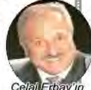
Celal Erbay'ın köşe yazısına yapılan yorumlar

" AZERBAYCAN-BAKÜ'DEN SELAM ve SAYGILARIMLA " Yazısına gelen yorum şöyle: