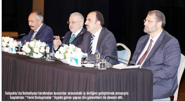
Selçuklu'da Belediyesi tarafından kurumlar arasındaki iş birliğini geliştirmek amacıyla başlatılan "Yerel Buluşmalar" ilçede görev yapan din görevlileri ile devam etti.