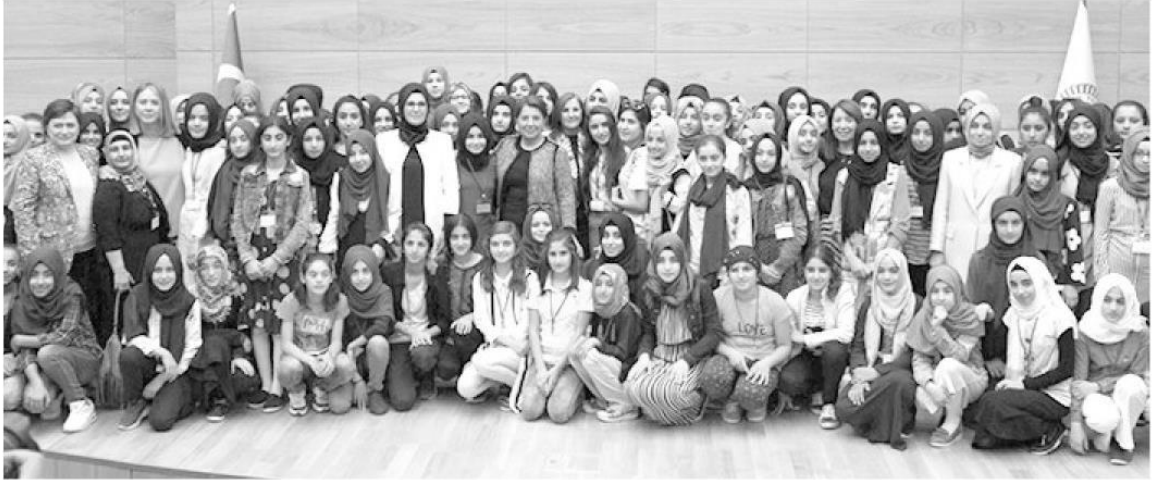
Şırnak, Mardin ve Cizre'den gelen kız çocukları, TBMM Başkanvekili Ayşe Nur Bahçekapılı ve TBMM Kadın Erkek Fırsat Eşitliği Komisyonu Başkanı Radiye Sezer Katırcıoğlu tarafından karşılandı.