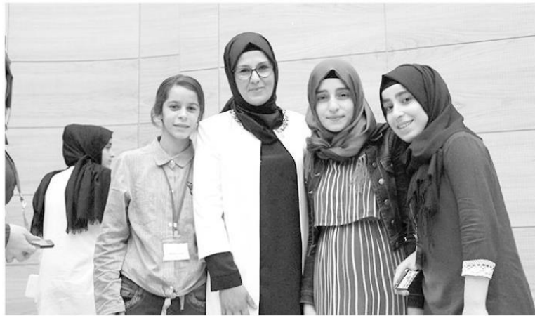
Çocuklarla yakından ilgilenen TBMM Kadın ve Erkek Fırsat Eşitliği Komisyonu Başkanı Radiye Sezer Katırcıoğlu, onlarla sohbet etti.

TBMM Kadın Erkek Fırsat Eşitliği Komisyonu Başkanı Radiye Sezer Katırcıoğlu yaptığı açıklamada, "Çok anlamlı ve yerinde olan bu projenin, terörle mücadelede sadece güvenlik güçlerinin tek başına başaracağı bir mücadele olmadığını, dolayısıyla topyekün bütün halkın, doğusundan batısına birlik, beraberlik ve kardeşlik içinde hareket etmesi gerekmektedir." Konuşmasının devamında, "Terör