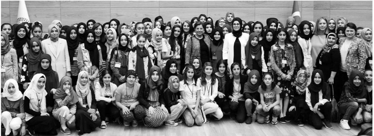
Terör mağduru kız çocukları, milletin meclisinde ağırlandı