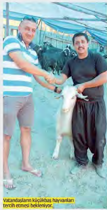
Vatandaşların küçükbaş hayvanları tercih etmesi bekleniyor.