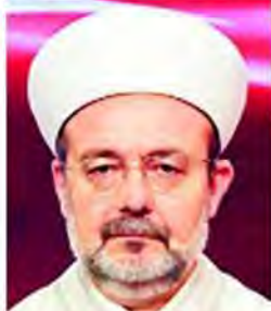
Diyanet İşleri Başkanı Prof. Dr. Mehmet Görmez

Meydanlara koşan halk hep birlikte namaz kıldı. Hep bir ağızdan "Hainlere fırsat vermeyeceğiz. Bu ülke sahipsiz değil" dedi.