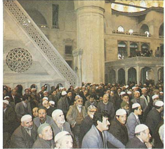
Kocatepe Camii'nde ilk Cuma namazı...

9 Mayıs 1986 Cuma günü ibadete açılan Kocatepe Camii külliyesi içerisinde yer alan 650 kişilik konferans salonunda ilk toplantı 30.4.1986 tarihinde yapıldı. Diyanet İşleri Başkanlığı tarafından yurduşına Ramazan görevlisi olarak gönderilen "Din Görevlileri" ile yapılan toplantı münasebetiyle ilk defa hizmete açılan salonda Başkan yardımcıları ve Daire Başkanları görevlilere çeşitli konularda bilgiler verdiler.