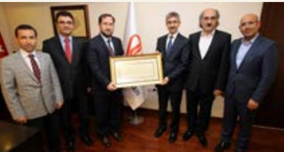
MEB Din Hizmetleri Heyeti