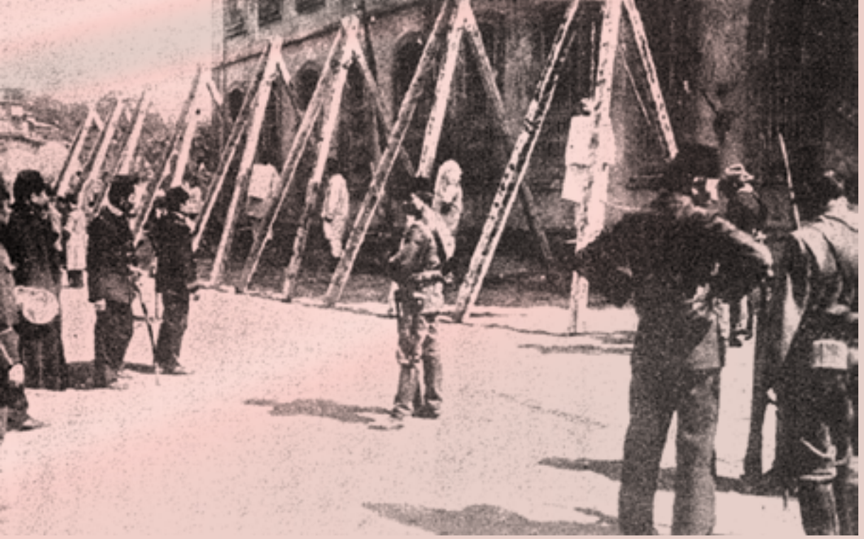
İttihatçılar tarafından Kasımpaşa'da Divanhane kapısında 31 Mart isyanına katılan askerlerin idam edilişleri

günü Sultan Abdülhamid'i hal' ederek Selanik'e sürdüler. İngiliz destekli darbe başarıya ulaşmıştı. İttihat ve Terakki denilen kanlı Balkan komitesi Sultan Abdülhamid'in şahsına değil Türk milletine ve Türk tarihine darbe vurmuştu. Bunun bir emsali daha tarihte yoktur diyorduk. Hiçbir vatan evladı, kendi halkına kurşun sıkamaz diyorduk. Bu ihanet bir daha tekrarlanmaz diyorduk.