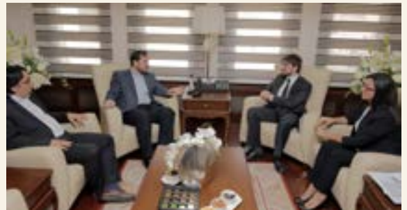
Türk Kızılayı Heyeti