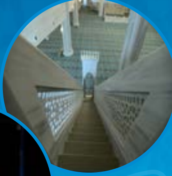
Kubbeli ve Çatılı Her Türlü Cami ve Dini Yapılar