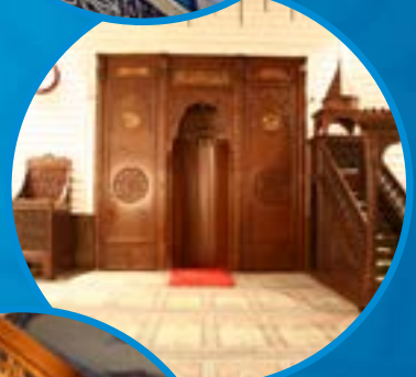
Konut ve Ticari Alanlar