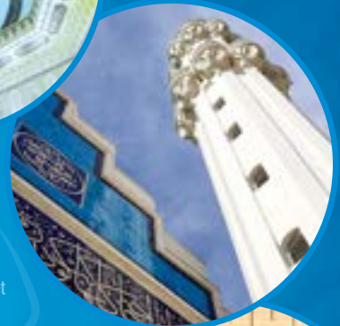
Kamu ve Sosyal Hizmet Binaları